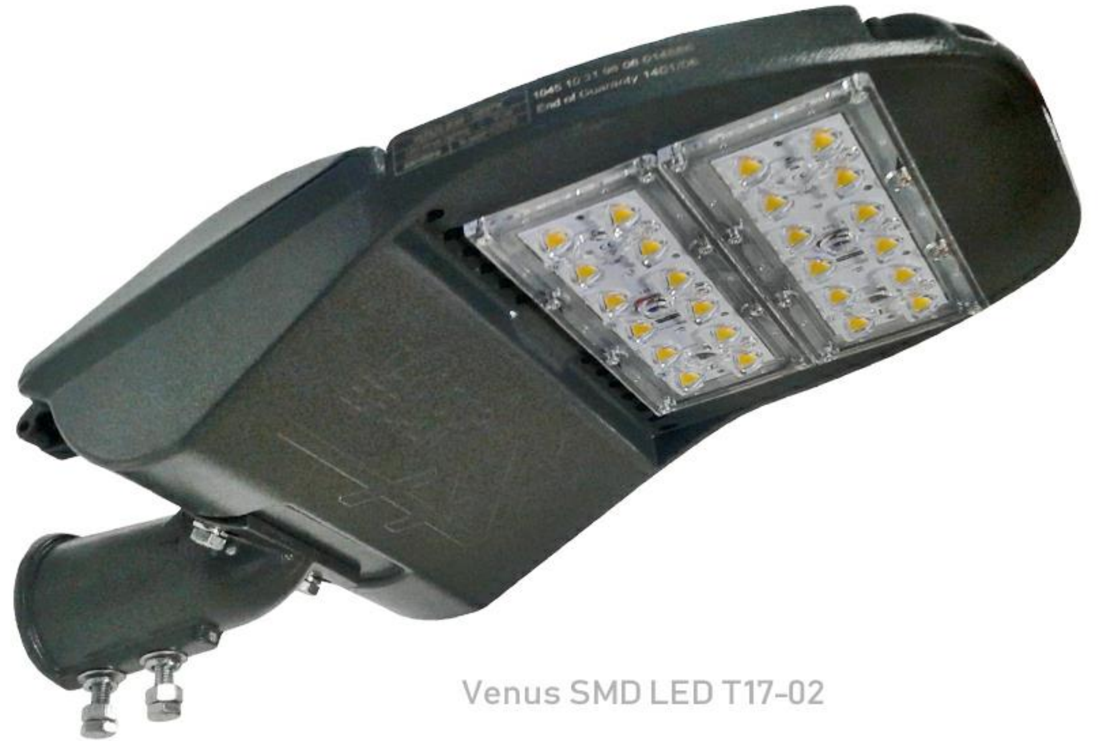
Venus SMD LED T17-02