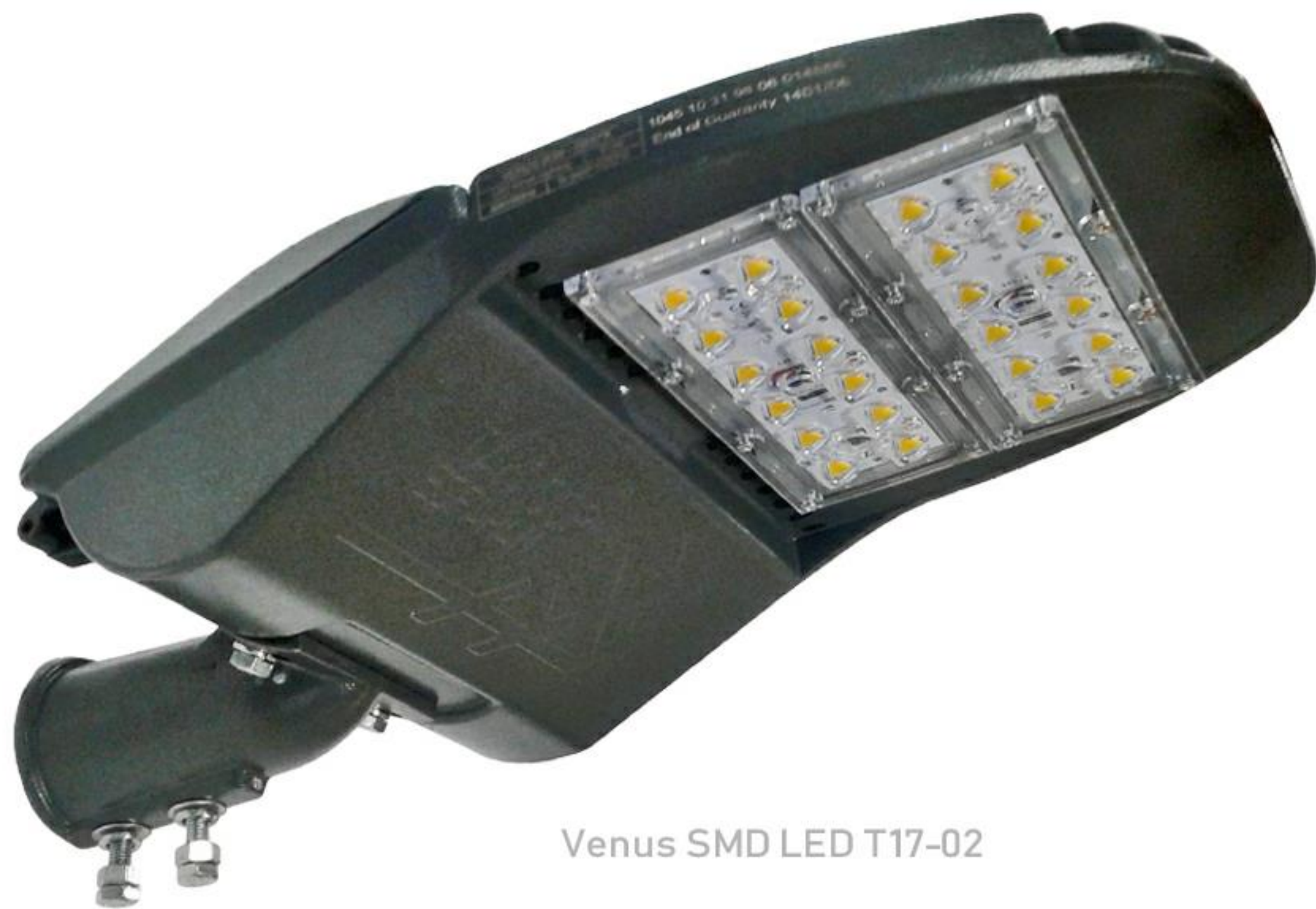
Venus SMD LED T17-02