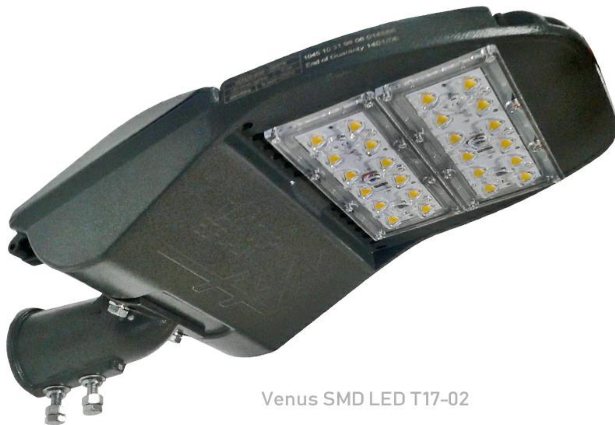
Venus SMD LED T17-02