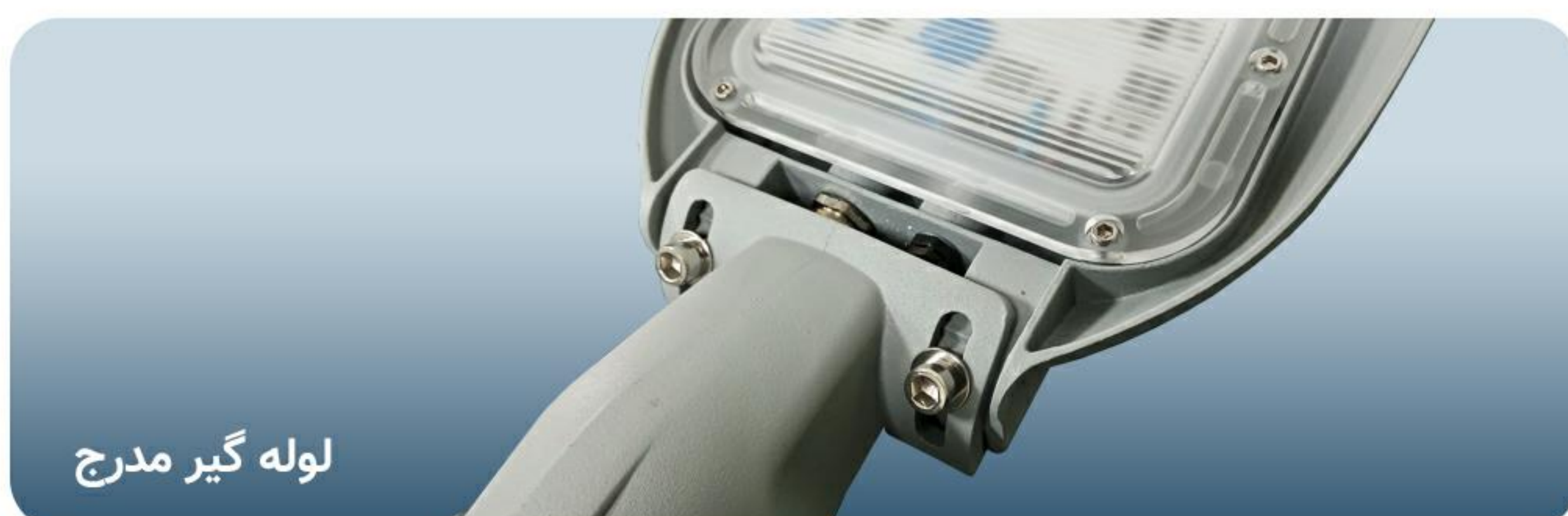
لوله گیر مدرج